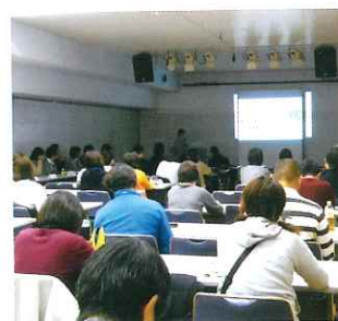
昨年度の連絡会風景

放課後等デイサービス事業所等連絡会(以下、「連絡会」という)は、2014年度に法人の呼び掛けで開催した連絡会です。放課後等デイサービス事業については、2012年度の児童福祉法の改正により、学校の放課後や長期休暇における障がい児童の療育を目的としたデイサービスです。伊丹市においても多数の事業所が実施しており、それぞれの事業所が事業の目的を確認し、さらに特別支援学校等との情報共有が必要なことから実施しました。この連絡会は、実施後6年を経過し、参加事業所も増え、すっかり定着した連絡会となっています。今年度は、コロナの影響を受け開催できていませんでしたが、10月22日に今年最初の連絡会を開催しました。