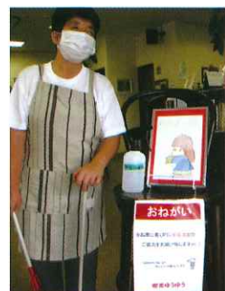
喫茶での感染防止