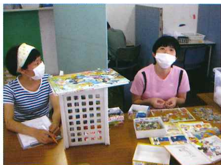
マスクをしておきの活動