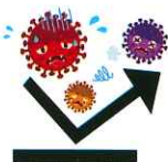
飛沫防止カーテンの設置 (左) サポートセンターいたみ杉の子玄関 (上) ゆうゆう食堂