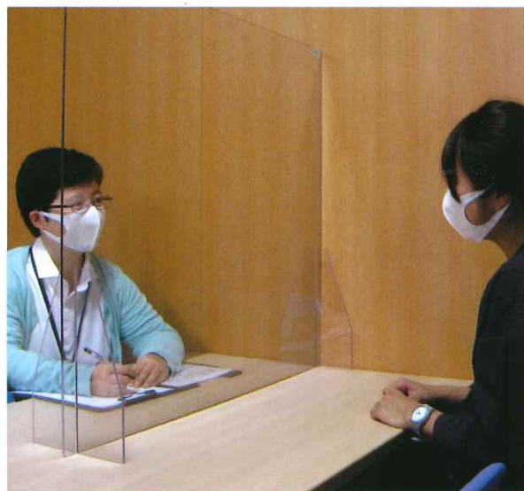
面接等におけるパーテーションの設置