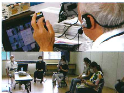
オンライン会議・感染予防の上での研修の様子