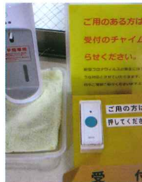
各所に消毒液を設置

今年に入って大きな社会問題となっている「新型コロナウイルス」。「いたみ杉の子」においてもイベントの中止、支援方法の再検討など事業計画に大幅な変更を余儀なくされています。そのような状況の中、未だ、治療方法が確立しない感染症であるため、法人としては、何よりも予防に最大限努めています。