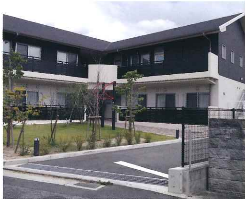
昨年度、開所した「ガーデンハイツの子」