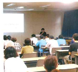
コロナ対策に配慮した研修会

法人では、兵庫県より「障害児等療育支援事業」を受託し連携室において担当していますが、その事業の一環として障がい児者の支援に携わる支援員等を対象とした公開研修会を実施しています。例年、関心の高い課題をテーマに4~6回の公開研修を開催しています。今年度は、コロナの影響を受けたものの第1回目の研修を9月4日に「障害者の高齢化」をテーマに開催しました。今後は、法人内事例検討会も含め公開研修を3回・家族向け学習会を2回実施予定です。